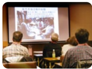
コーディネーター派遣制度

専門家を招き、ワークショップや勉強会を開催。地域づくり活動への助言が受けられます。当協会から専門家・コーディネーターを紹介できます。