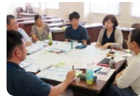
石川地域づくり塾

地域リーダー育成を目的とした石川地域づくり塾を受講することができます。1年間をととした連続講座です。