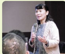
能登乃國ゆするぎ塾

石川県災害ボランティア協会から講師を招き、さまざまな災害や地域防災の基礎知識をお話いただきました。避難時に利用できる簡易トイレや新聞紙スリッパを作るワークショップも好評でした。