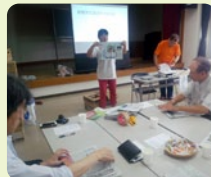
かなざわご近所コラボプロジェクト

郷土史の編集方法について協会コーディネーターから指導を受けました。テーマや項目の選び方、資料収集などの他、住民を巻き込む意味や読まれるための工夫の重要性についても学びました。